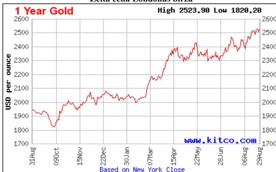
Zelta cena Londonas biržā

Birojs turpina darbu pie biroja telpu pārvietošanas uz jaunām telpām ēkā Vecpilsētas ielā 7, Rīgā, pabeidzot darbu pie būvniecības projekta izstrādes un būvniecības pakalpojumu iepirkuma. 2024. gada 3. ceturksnī ir noslēgts būvniecības līgums (SIA KUUM, 2271835 euro) un uzsākti būvniecības darbi.