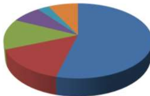
Zīmogoto izstrādājumu sadalījums pēc izstrādājumu veida

2018.gadā VSIA „Latvijas probes birojs” ir noprovējis un zīmogojis: